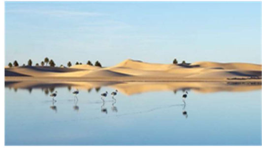
بحيرة حاسي بن عبد الله