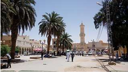
القصبة (القصر العتيق)