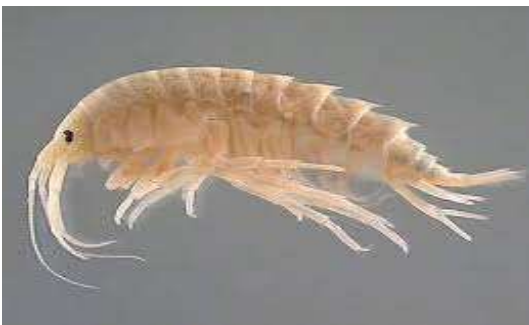
يحل الجمبري محل التمرور في ورقلة - حاسي بن عبد الله