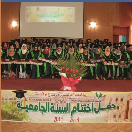
إختتام السنة الجامعية