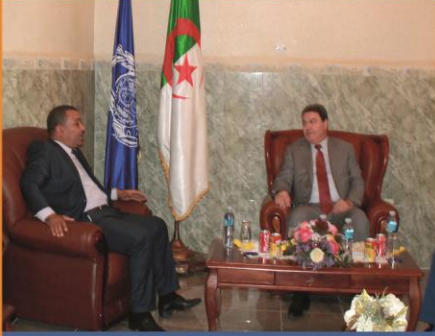
يوم تحسيسى لأفراد الأمن

نشرة إخبارية دورية تصدر عن جامعة قاصدي مرباح - العدد 2015/29 www.univ-ouargla.dz