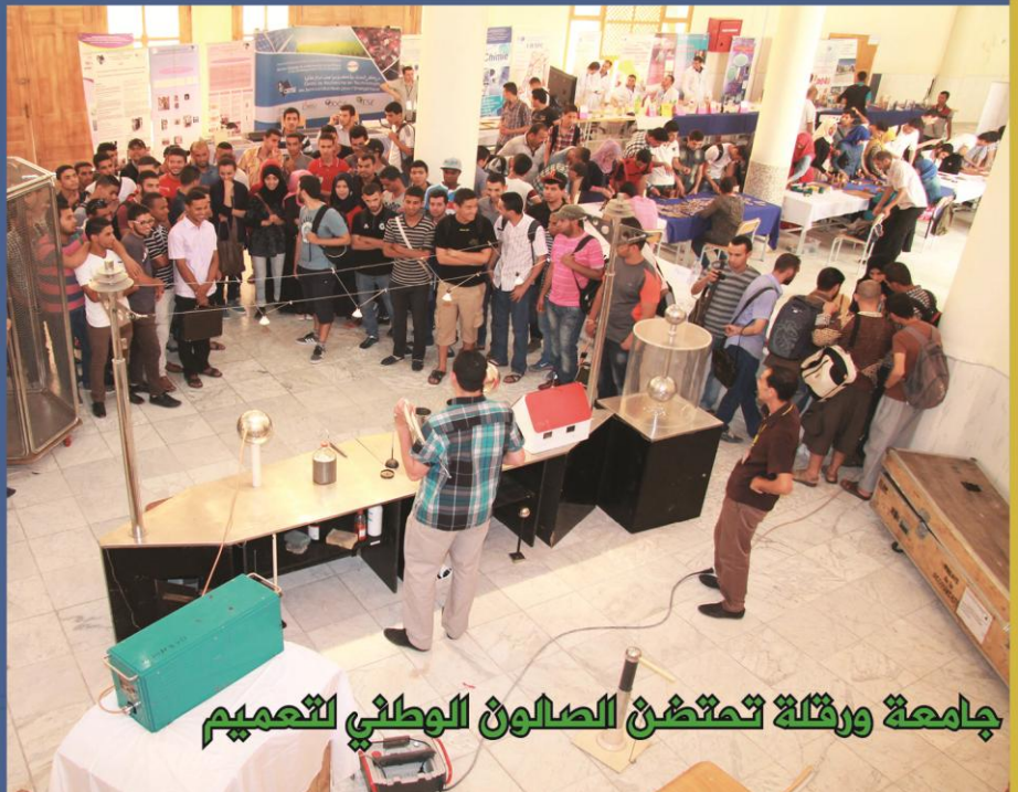
جامعة ورقلة تمتن الصالون الوطني للتعميم