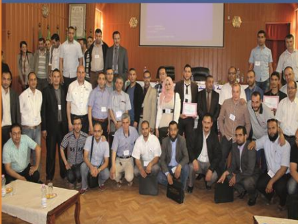
الأيام الدراسية الوطنية في الميكانيك