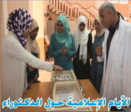
الأيام الإعلامية حول الدكتوراه