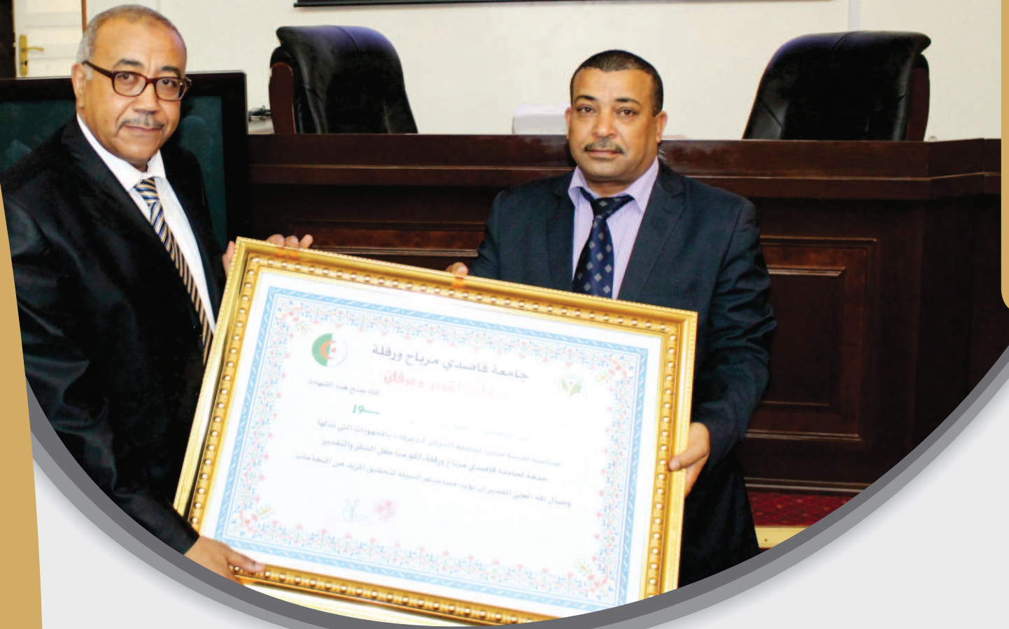
إدارة جامعة قاصدي مرباح ورقلة تنظم