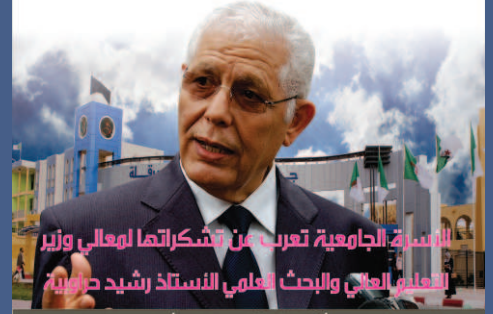
الأسرة الجامعية تعرب عن تشكراتها لمعالي وزير التعليم العالي والبحث العلمي " الأستاذ رشيد حراوية "

الجامعة لتتويجهما بالمراتب الأولى في البطولة الوطنية للرياضة الجامعية.