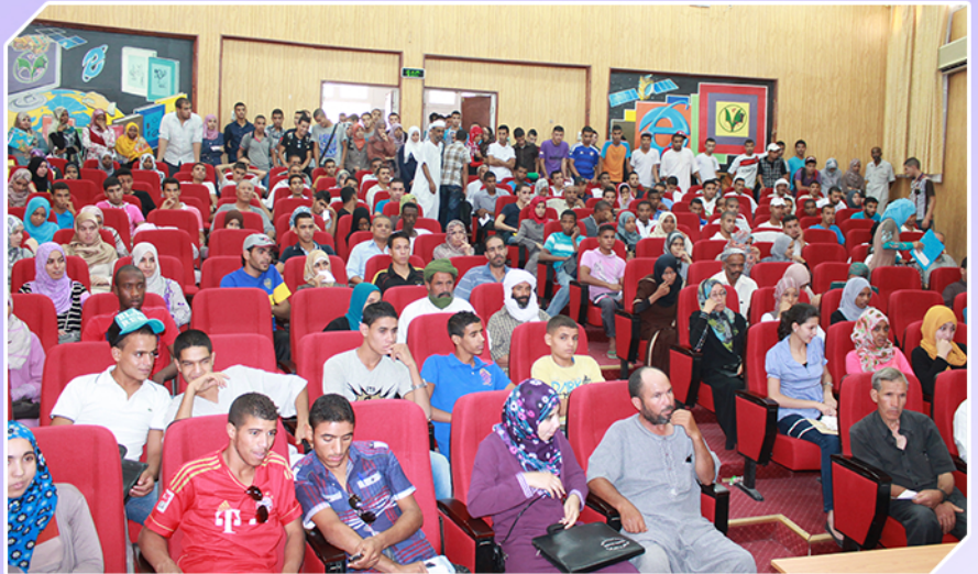
التسجيلات الجامعية 2015/2014