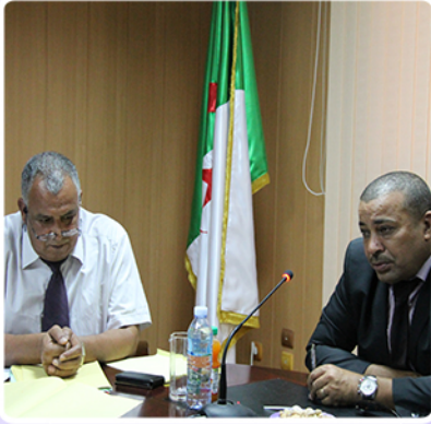
تنصيب وحدة بحث