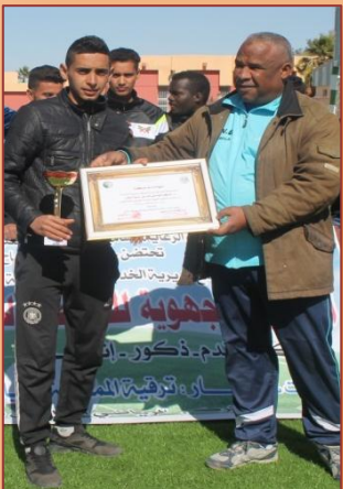
روبو رتاج حول الرياضة الجامعية